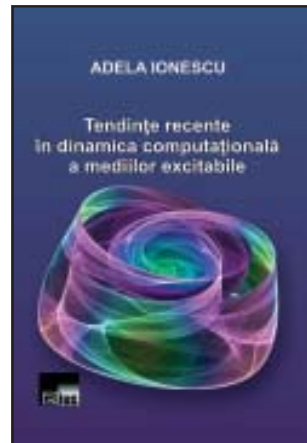
Adela Ionescu, Tendințe recente în dinamica computațională a mediilor excitabile , Colecția „Studia”, Editura Aius, Craiova, 2012.

L ucrarea își propune să construiască o teorie coerentă pentru ideea că un model de mixing într-un mediu excitabil conduce în mod inevitabil la un model departe de echilibru. Autoarea se concentrează asupra unor rezultate deosebite de analiză a eficienței mixing-ului pentru mediile doi și trei dimensionale. Este de remarcat buna concordanță dintre rezultatele experimentale și cele de modelare matematică/simulare computațională.