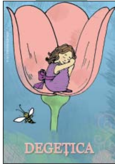
Hans Christian Andersen, Degețica , Colecția „Punguța cu povești”, Editura Aius, Craiova, 2012.

C ărticica Merlin, micuțul vrăjitor cuprinde cinci povești despre copilăria celui mai faimos vrăjitor cunoscut vreodată de copiii din lumea întreagă. Astfel aflăm cum Merlin vorbea din prima zi a vieții sale și a uimit satul din Bretania în care s-a născut cu darul său de a vedea ce este în sufletul oamenilor. Apoi, micul Merlin le transformă pe trei femei, care îi batjocoreau mama, în coțofene, pedesindu-le și făcându-le să se căiască pentru comportamentul lor. În cea de-a treia poveste, Merlin îl scoate din încurcătură pe însuși împăratul Romei. De asemenea, micul vrăjitor va ajuta o familie de bătrâni săraci ajunși într-un moment de cumpănă al vieții lor și îi va da o lecție de viață avarului Gonnebert, spre amuzamentul sătenilor bretoni. Primele aventuri ale micuțului Merlin ne amintesc de vremurile străvechi în care înțelepciunea și umorul făceau casă bună cu simțul dreptății și cu voia bună.