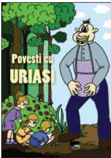
Povești cu uriași: Uriașul Periferilerigerimini de Charles Perrault, Kwangip birutorul și Uriașul Hannush (Poveste din Tara de Foe), Uriașul cel egosit de Oscar Wilde, Colecția „Punguța cu povești”, Editura Aius, Craiova, 2012.

P ovestea Degețel (sau Prichindel ) a fost publicată pentru prima dată, în limba franceză, de Charles Perrault (1628-1703) în culegerea Povești sau basme de odinioară cu moralități ori Poveștile mamei mele Gâsca (1697). Degețel este cel mai mic dintre cei șapte feciori ai unui sărac tăietor de lemne, însă în ciuda staturii sale prichindelul este foarte isteț. Când Degețel este abandonat în pădure, el va găsi tot felul de mijloace pentru a supraviețui împreună cu frații săi, reușind chiar să fure cizmele fermecate ale căpcăunului ceea ce îl va ajuta să ajungă crainicul împăratului și să își scape familia de la sărăcie.