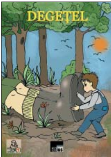
Charles Perrault, Degețel , Colecția „Punguța cu povești”, Editura Aius, Craiova, 2012.

P ovestea Degețel (sau Prichindel ) a fost publicată pentru prima dată, în limba franceză, de Charles Perrault (1628-1703) în culegerea Povești sau basme de odinioară cu moralități ori Poveștile mamei mele Gâsca (1697). Degețel este cel mai mic dintre cei șapte feciori ai unui sărac tăietor de lemne, însă în ciuda staturii sale prichindelul este foarte isteț. Când Degețel este abandonat în pădure, el va găsi tot felul de mijloace pentru a supraviețui împreună cu frații săi, reușind chiar să fure cizmele fermecate ale căpcăunului ceea ce îl va ajuta să ajungă crainicul împăratului și să își scape familia de la sărăcie.