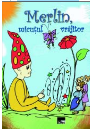
Merlin, micuțul vrăjitor (poveste franceză), Colecția „Punguța cu povești”, Editura Aius, Craiova, 2012.

C ărticica Merlin, micuțul vrăjitor cuprinde cinci povești despre copilăria celui mai faimos vrăjitor cunoscut vreodată de copiii din lumea întreagă. Astfel aflăm cum Merlin vorbea din prima zi a vieții sale și a uimit satul din Bretania în care s-a născut cu darul său de a vedea ce este în sufletul oamenilor. Apoi, micul Merlin le transformă pe trei femei, care îi batjocoreau mama, în coțofene, pedesindu-le și făcându-le să se căiască pentru comportamentul lor. În cea de-a treia poveste, Merlin îl scoate din încurcătură pe însuși împăratul Romei. De asemenea, micul vrăjitor va ajuta o familie de bătrâni săraci ajunși într-un moment de cumpănă al vieții lor și îi va da o lecție de viață avarului Gonnebert, spre amuzamentul sătenilor bretoni. Primele aventuri ale micuțului Merlin ne amintesc de vremurile străvechi în care înțelepciunea și umorul făceau casă bună cu simțul dreptății și cu voia bună.